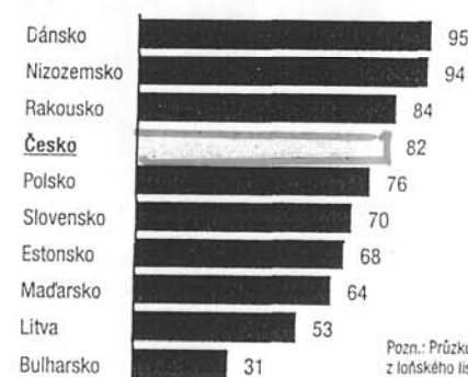
Míra spokojenosti s životní úrovní v Evropě [Satisfaction for living standards %] (v procentech)

Pozn.: Průzkum Evropské komise z loňského listopadu - prosince