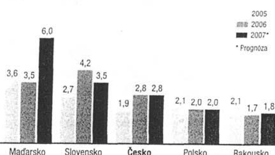
Růst spotřebitelských cen [Inflation %] (v procentech)