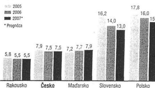
Míra nezaměstnanosti [Unemployment %] (v procentech)